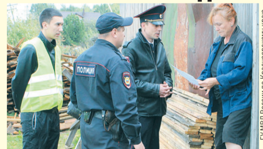
В ходе рейдов проверено 29 775 дач.

- Для того чтобы обезопасить дачников, полиция совместно с казначеством ежегодно проводит рейды по садовым товариществам, - рассказал начальник служ-