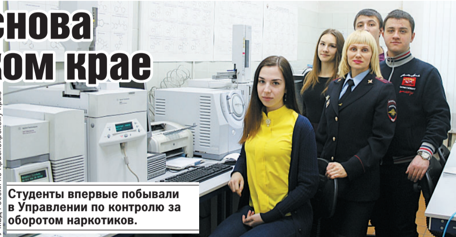
Студенты впервые побывали в Управлении по контролю за оборотом наркотиков.

грали с сотрудниками органов внутренних дел и членами Общественного совета в волейбол - подобные спортивные мероприятия особо любимы студентами.